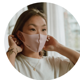
CONTAMINACIÓN DEL AIRE INTERIOR